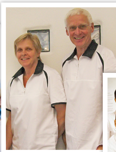
Tandhälsan i Malung.

"Kursen fick mig att upptäcka programmets fulla potential"